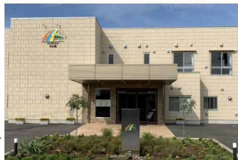
西上尾ホスピスケアそよ風 <外観>

11月に開設した、当社初となる末期がんや難病の看取り介護に特化した住宅型有料老人ホーム「西上尾ホスピスケアそよ風」は、末期がん患者と難病患者を専門に受け入れ在宅ホスピスのノウハウをもつ株式会社シーユーシー・ホスピス(以下、CUC)との協業で開設。