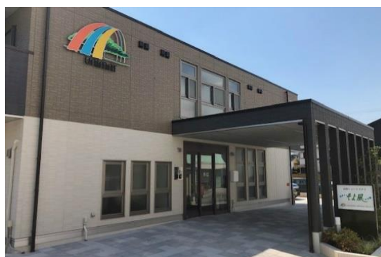
高砂ショートステイそよ風<外観>

同じく11月に開設した「高砂ショートステイそよ風」は、プライバシーに配慮した完全個室。“そよ風”の特徴でもある食事は、味や栄養のバランスはもちろん、食欲をそそる彩りにこだわり、季節を楽しむイベント食もご用意しています。浴室は車いすでも肩まで湯に浸かれる機械浴室や、プライバシーに配慮した個浴室を完備。スタッフの見守り・介助で安心・安全に入浴いただけます。季節ごとの行事やイベントなどのレクリエーションも充実し、快適にお過ごしいただける環境とサービスをご用意しています。