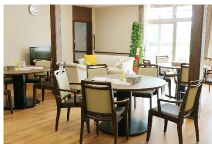
滑川グループホームそよ風<ダイニング>