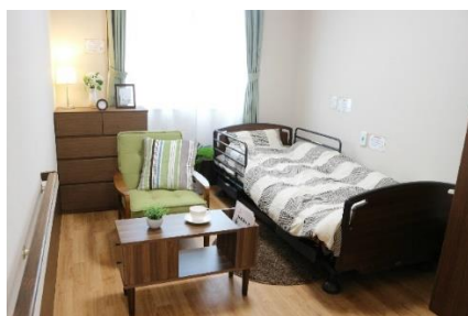
滑川グループホームそよ風<居室一例>

居室はプライバシーに配慮した完全個室で、愛着のある家具などを持ち込むことも可能。自宅に近い環境で和やかに過ごせるほか、食事の盛り付けや配膳など、料理や家事を通して家庭的な生活が続けられるようサポートします。また、共有スペースでは視力障害のサポートとして扉の色に変化をつけ、部屋の名札も自室がわかりやすくなるよう多色を用いています。さらに、身体や脳を使うレクリエーションを充実させ、生活の中で楽しみを見つけたり、他の入居者とのコミュニケーションを通して、穏やかに暮らせるようケアしていきます。