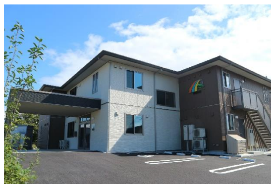
滑川グループホームそよ風<外観>

12月に開設した、雄大な立山連峰を望む立地の「滑川グループホームそよ風」は、認知症になってもその方らしく過ごせるよう、個々に寄り添うことを大切にされた専任のスタッフが24時間体制で暮らしをお手伝いします。