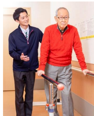
「そよ風」の介護サービス(イメージ)

自分らしく日常生活を送るうえで必要な自立の可能性を引き出す介護サービスを提供いたします。例えば、「経管栄養ではなく食事を味わって食べたい」や「おむつではなくトイレで排泄したい」、「自分で歩きたい」など、もともと出来ていたことを再びできるようになるよう、個々に寄り添った取組みを行っています。