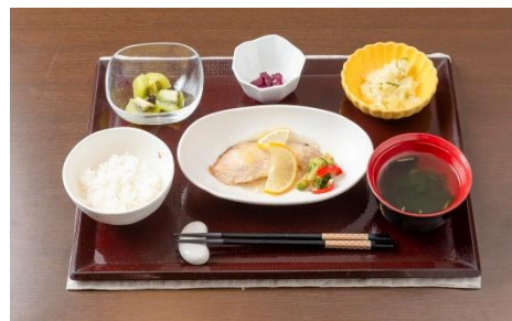
「そよ風」の食(昼食イメージ)

「そよ風」の特徴の一つに施設厨房の直営率が約 90%と高いことがあげられ、管理栄養士 111 名、栄養士 242 名、厨房職員 1,016 名 (2020 年 2 月時点)と多くの職員が勤務しています。これは、高齢者介護施設として大変珍しいことです。食べるということは、元気で過ごすためにも欠かせないことであり、日々の生活の中でも“食事がおいしい”と思えることは、食事が楽しみになるという重要なことでもあります。栄養バランスに優れていることはもちろん、出来たての温かくおいしい食事を提供することは「そよ風」のこだわりです。