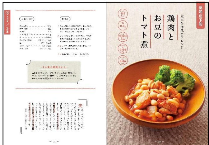
認知症予防レシピの一部

「おいしい制限食を知りたい!」「効率的に栄養補給したい!」「おいしい予防食を知りたい!」などのお悩みを解決するレシピをエピソードとともに紹介しています。