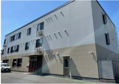
藤枝ケアセンターそよ風<外観>