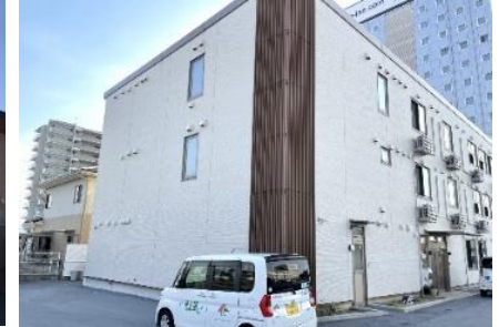
彦根ケアセンターそよ風<外観>

今後も施設の事業譲受および新規開設をはじめ、高齢者が住み慣れた地域で生活を続けられるよう、「そよ風の地域包括ケア」として様々なサービス展開に積極的に取り組んでまいります。