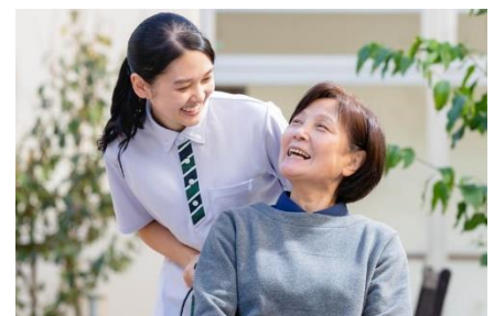
「そよ風」の介護サービスイメージ

利用者の可能性を引き出し「できなくなってしまったこと」を元気だった頃のように「再びできるようにする」ための支援をしたいと考えています。例えば、寝たきりだった方が歩けるように、オムツをしていた方がひとりでトイレに行けるようになるなど、自分らしく生活できるように、利用者自身でできることと支援が必要なことを見極めて自立を支援します。