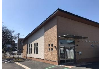
わごうケアセンターそよ風<外観>