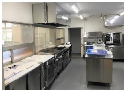
松本ケアセンターそよ風＜厨房＞