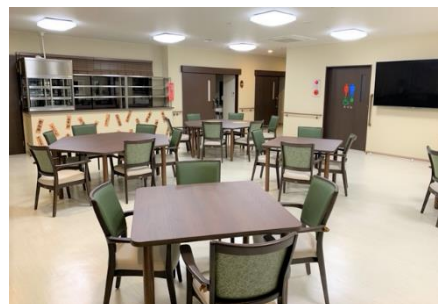
松江西津田ショートステイそよ風<共有スペース>