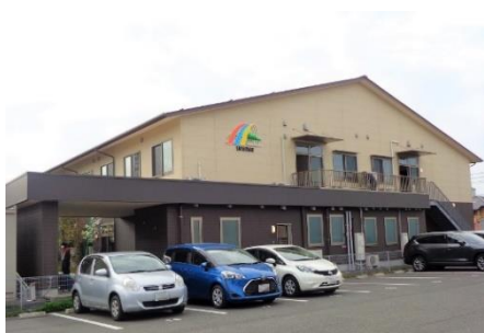
松江西津田ショートステイそよ風<外観>

https://www.unimat-rc.co.jp/shisetsu-zaitaku/324403