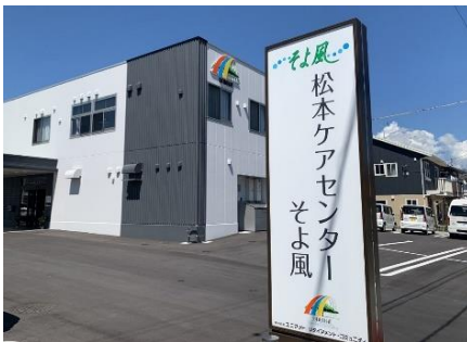
松本ケアセンターそよ風＜外観＞

ショートステイ https://www.unimat-rc.co.jp/shisetsu-zaitaku/204413