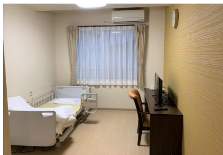
松江西津田ショートステイそよ風<居室一例>