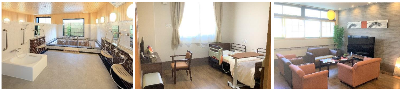
高崎ケアセンターそよ風(左)浴室、(中)ショートステイ居室一例、(右)ショートステイ共有スペース