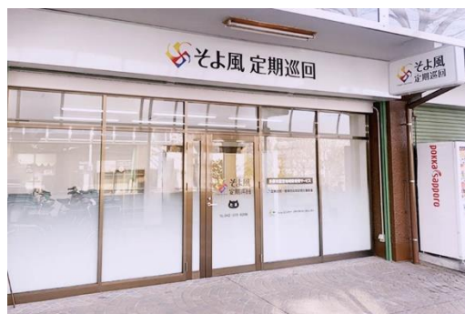
「そよ風定期巡回 たま」外観

https://www.unimat-rc.co.jp/shisetsu-zaitaku/134605