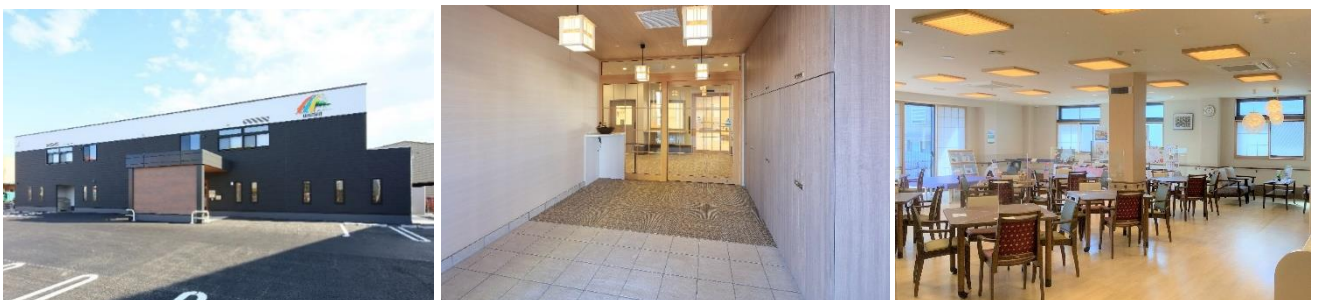
高崎ケアセンターそよ風(左)外観、(中)エントランス、(右)食堂兼機能訓練室

ショートステイ https://www.unimat-rc.co.jp/shisetsu-zaitaku/104563