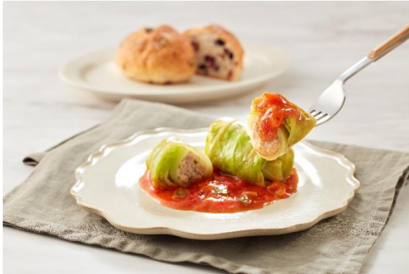
「ロールキャベツ(トマトソース)」イメージ

メニュー開発にあたり名だたる名店に足繁く通い、研究を重ね、外食のように食べる楽しみを満たすクオリティを目指しました。「GRAND DELICA」は一般的なフローズンミールではあまり使われることのないピスタチオやドライトマト、アボカドなどの食材もふんだんに採用することで、リッチな味わいと一品ごとに変化する味や食感を生み出し、フローズンミールとは思えないおいしさを実現しています。