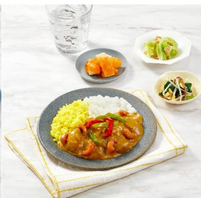
「マッサマンカレー」 盛りつけイメージ