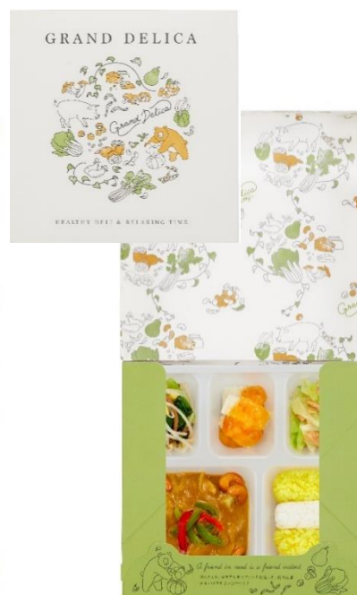
マッサマンカレー