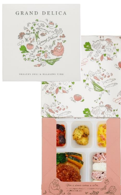
ハンバーグのシャリアピンソース)