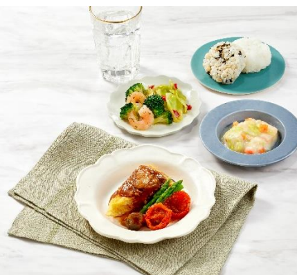
「スペイン風オムレツ(デミソース)」 盛りつけイメージ