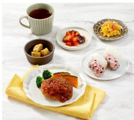
「ハンバーグのシャリアピンソース」 盛りつけイメージ