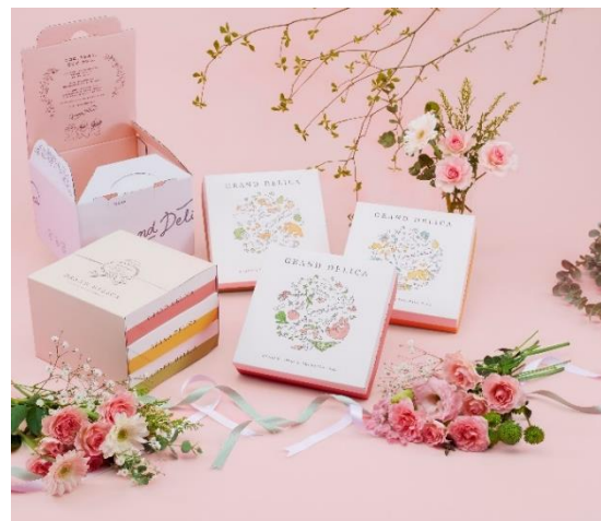
「GRAN DELICA」パッケージデザイン

そして、パッケージを開けると彩り鮮やかなメニューがバランスよく盛りつけられています。多彩な味わいと食感を楽しめる4品のおかずは野菜もふんだんに使用されているのがうれしいポイントの一つ。ご飯は約70gと少なめで雑穀米などをあわせています。