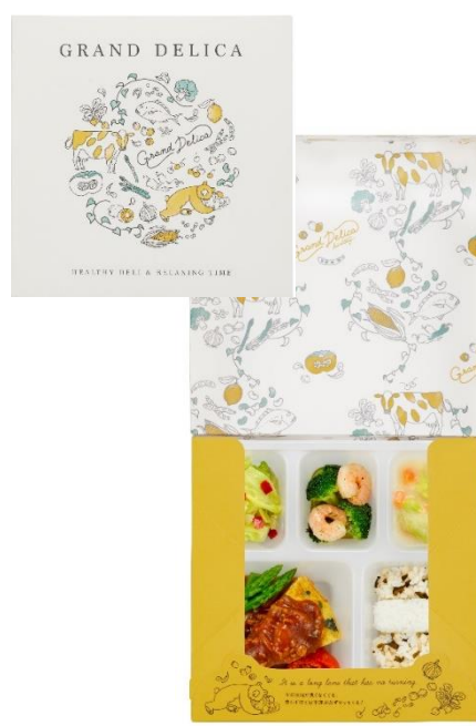
スペイン風オムレツ(デミソース)