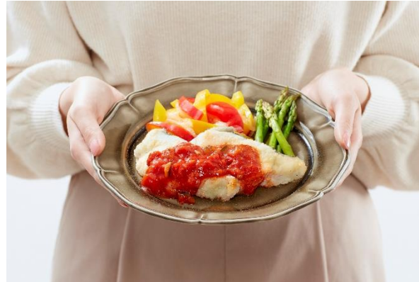
「鱈のサルサソース」イメージ