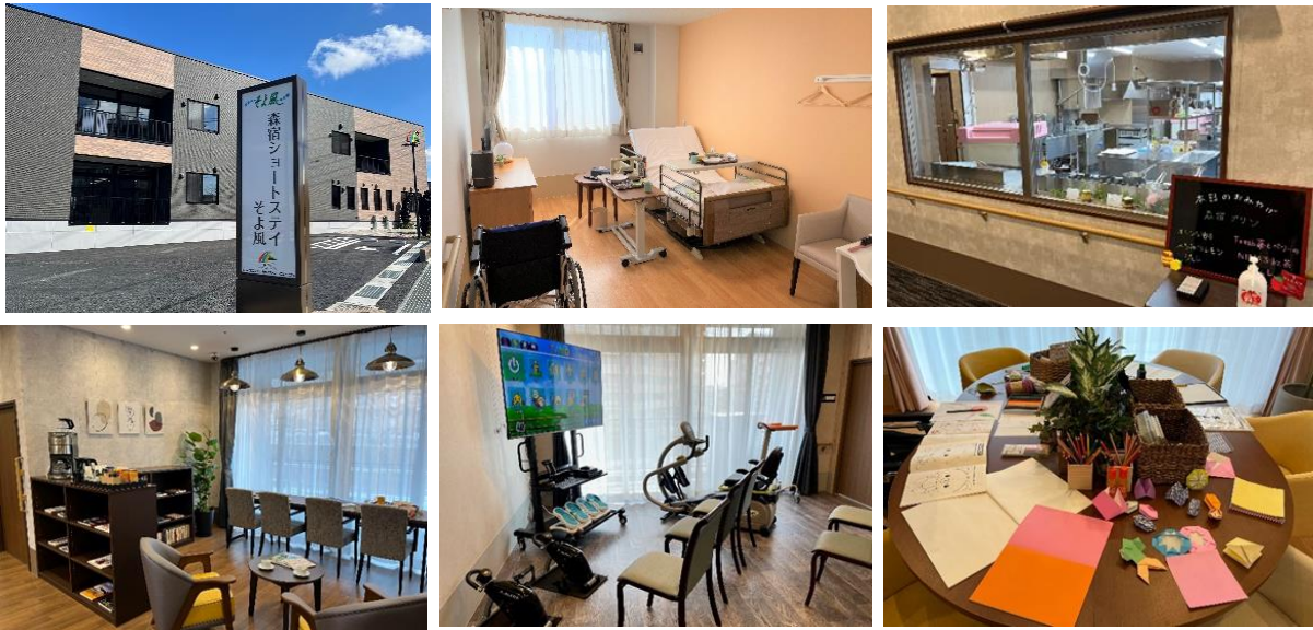
森宿ショートステイそよ風(左上)外観、(中上)居室一例、(右上)厨房前に設けられた窓 (左下)月灯ユニット(ブックカフェ)、(中下)翡翠ユニット(機能訓練)、(右下)牡丹ユニット(創作活動)

ショートステイ https://www.unimat-rc.co.jp/shisetsu-zaitaku/074543