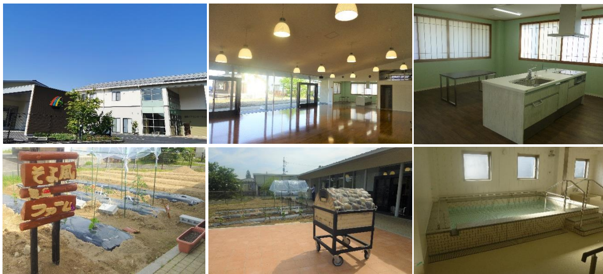
雲南ケアセンターそよ風(左上)外観、(中上)デイサービスフロア、(右上)生活リハビリ用アイランドキッチン (左下)施設専用の畑「そよ風ファーム」、(中下)ガーデンテラスとピザ窯、(右下)大浴場

デイサービス https://www.unimat-rc.co.jp/shisetsu-zaitaku/324631