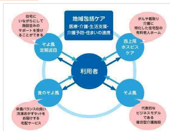
「そよ風」の地域包括ケア(イメージ図)

身体の状態やニーズの変更に合わせた各種サービスの提供並びに変更に伴う煩雑な手続きの負担を軽減するため、利用者情報を一括管理し、趣味趣向など細かな情報も引き継ぐことが可能です。利用サービスが変わっても安心してご利用いただけるのも「そよ風」の特徴です。