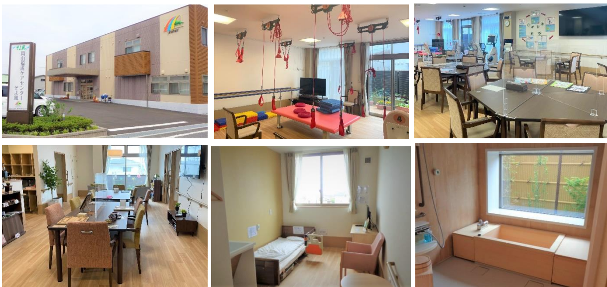
岡山福成ケアセンターそよ風(左上)外観、(中上)機能訓練スペース、(右上)食堂 (左下)ショートステイ共同フロア、(中下)ショートステイ居室一例、(右下)浴室・檜風呂

デイサービス https://www.unimat-rc.co.jp/shisetsu-zaitaku/334591