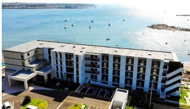
「マゼラン湘南佐島」外観