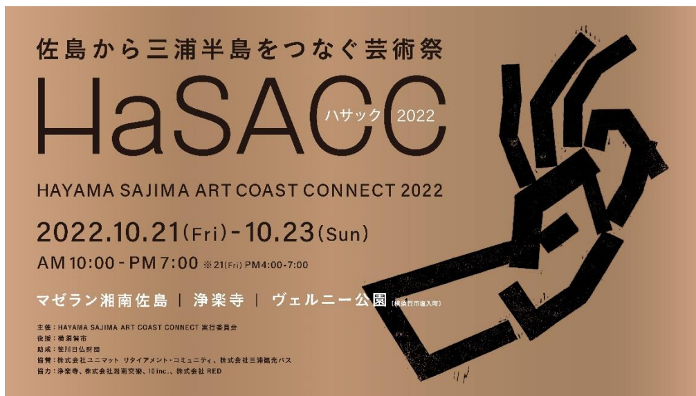
「HAYAMA SAJIMA ART COAST CONNECT 2022」ビジュアル

「HAYAMA SAJIMA ART COAST CONNECT 2022(以下:HaSACC 2022)」のコンセプトは「葉山・佐島・横須賀を、アートを巡る旅で楽しみ、人々がつながろう。」です。長引くコロナ禍でリアルな人とのつながりが希薄になりつつある中、さまざまなアートを通じ、葉山・佐島・横須賀の新たな魅力を発見してもらい、三浦半島を盛り上げるとともに人々のつながりを広げていくことを目指します。