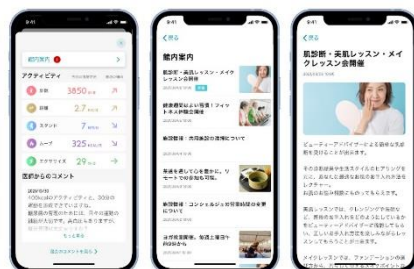
iPhone アドバイスおよび施設案内イメージ