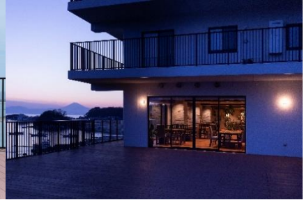
テラスからは相模湾と富士山を一望(夕景)