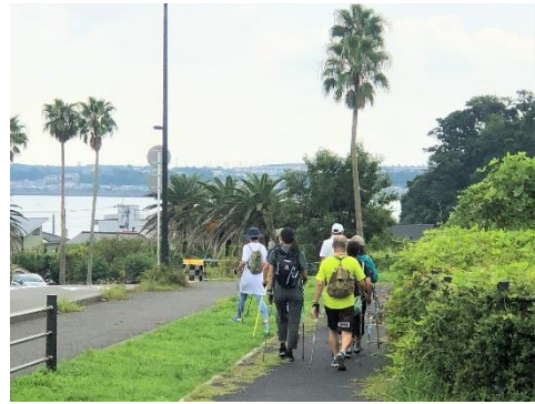
ノルディックウォーキングの様子(一例)

一例として、佐島の海や山などの自然を満喫できるコンテンツとして相模湾船釣り、SAP、大楠山ハイキング、江の島周遊クルージングなどのアクティビティを実施。そして入居するお客様自らが得意とすることを活かせる機会づくりなど、施設内外で活動的に取り組める仕組みを構築し提供します。