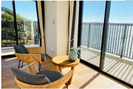
居室からの眺望一例