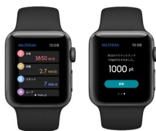
Apple Watch 表示イメージ