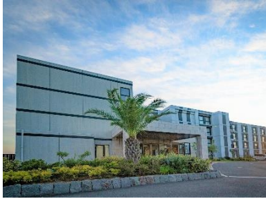
「マゼラン湘南佐島」外観