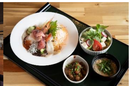
レストラン メニュー例