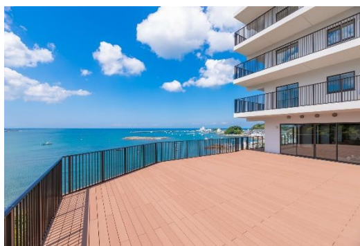
テラスからの眺望(一例)

名 称:マゼラン湘南佐島 所 在 地:神奈川県横須賀市佐島 1-14-1 サービス:健康型有料老人ホーム 入居条件:60 歳以上、自立 居 室 数:50 室(3~5 階/個室/全室海側) ホームページ: https://mazeran-web.com/sajima/