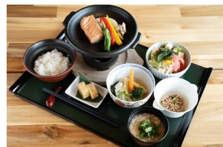
入居者用食事メニュー(イメージ)

【2】「地域コミュニティの拠点」として入居者のやりがい・生きがいを創出 健康を増進するには、「食事」「運動」「社会参加」の 3 つの要素が不可欠です。なかでも「社会参加」は、他の「食事」「運動」に比べて個人での取り組みが難しい要素です。そのサポートの一つとして「マゼラン湘南佐島」では、これまでに神奈川県「未病産業研究会」と共催の未病イベント、ヨガやノルディックウォーキングを組み合わせた宿泊イベント、美容・健康フェアなどを開催してきました。