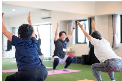
館内フィットネスでのトレーニング(イメージ)

一例として、医師によるアドバイスと施設フィットネスとの連動、スタッフによる日常的な声かけにより、血圧の改善や理想体重への減少を実現。また、一人では継続が難しいが他の入居する仲間と一緒に取り組むことでのモチベーション維持など、心身ともに充実した生活を送られる様子を見ることができました。