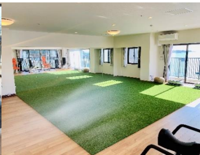
フィットネスルーム