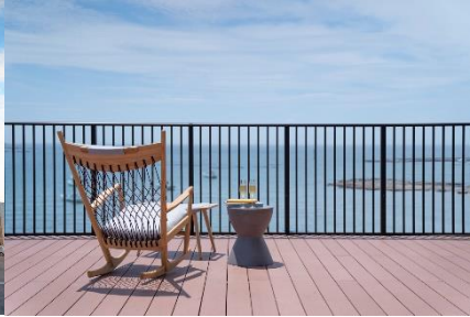
テラスからの眺望一例