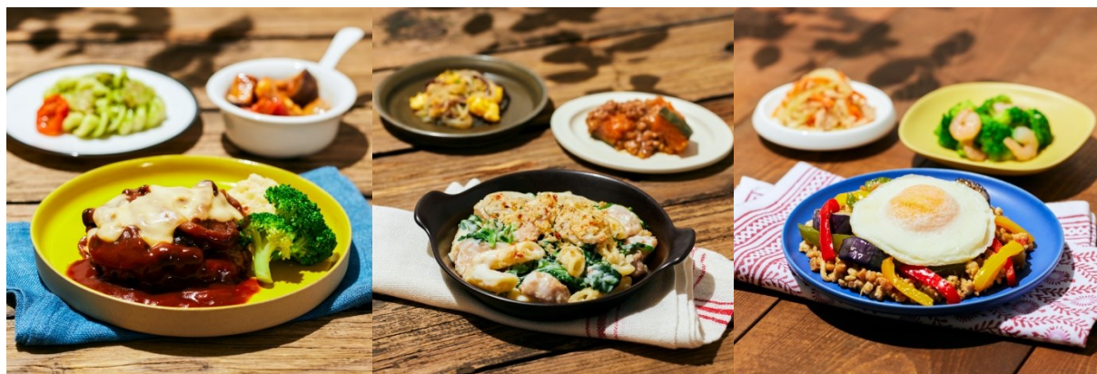
kanau 盛り付け例(左)4 種チーズときのこの濃厚デミグラスハンバーグ、(中)チキンとほうれん草のクリームグラタン、(右)とろーりたまごのガバオ風