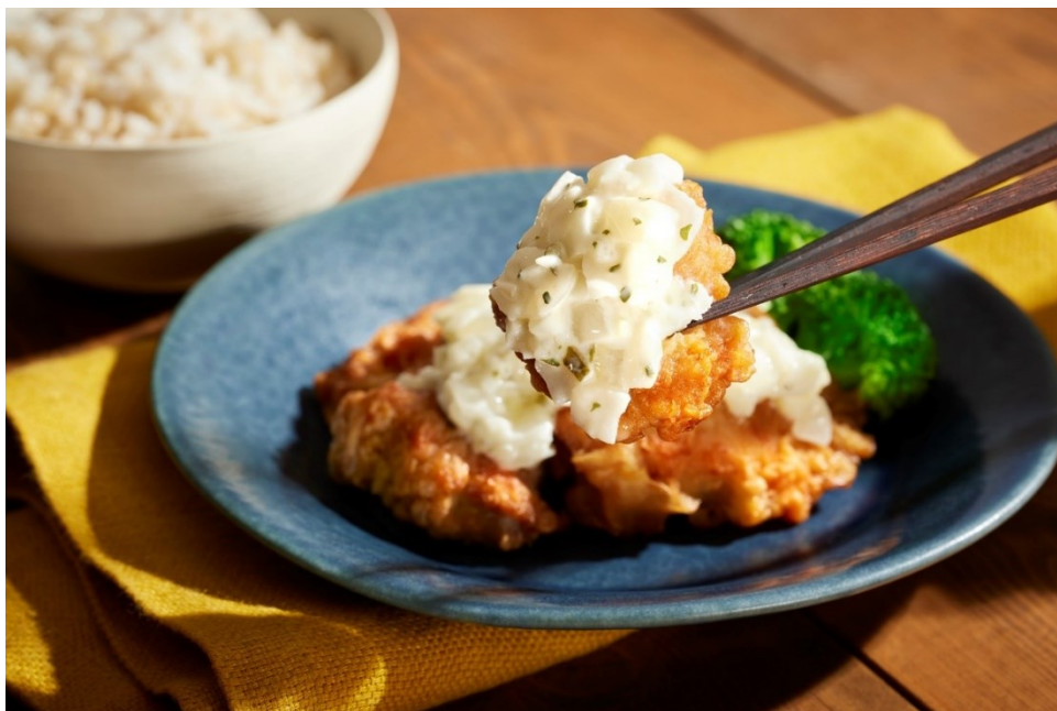
管理栄養士が監修した栄養バランスのよさに加え“おいしさ”にとことんこだわった冷凍弁当「食のそよ風」 写真は kanau「自家製タルタルソースで食べる鶏唐揚げ」「もち麦ごはん」盛り付け例