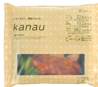
たんぱく質と食物繊維の配合を強化した「食のそよ風」kanau シリーズ商品パッケージ