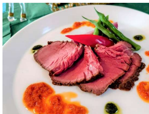
国産牛のローストビーフ(イメージ)

オードブルヴァリエ、カブのヴルーテ、ブイヤベースのパイ包焼き、 国産牛のローストビーフ、ガトーオペラ、パン、コーヒーまたは紅茶