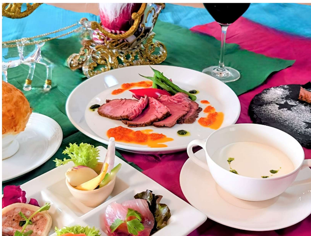
地元の新鮮な食材を使用した「マゼラン 湘南佐島」のクリスマススペシャルディナー(イメージ)

「マゼラン 湘南佐島」公式ホームページ: https://mazeran-web.com/sajima/