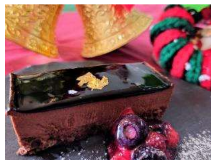
クリスマス デザート(イメージ)