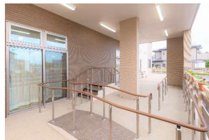
屋外歩行訓練スペース

屋外歩行訓練スペースや専用マシンを備え、お客様一人ひとりの目標に合わせたプログラムを提供。身体機能の維持・向上を目指し、より自立した生活をサポートします。