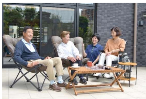
「そよ風」施設滞在イメージ

「そよ風」では、同一施設内で複数のサービスを提供する複合施設を多数展開している点が大きな特徴です。また、近隣エリアとの連携を通じて、お客様の身体状況や生活に合わせたスムーズなケア移行を実現しています。