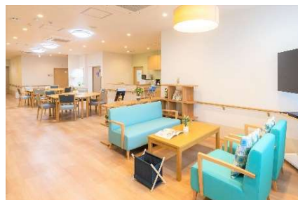
ショートステイ 共同フロア

ショートステイの居室には、ベッド上の体動を計測する見守りシステムを導入。測定データはご家族やケアマネジャーと共有し、より適切なケアプラン作成に役立てます。