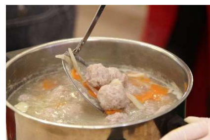
昼食の調理イベント(イメージ)

昼食時には、お客様と一緒に料理を楽しむイベントを実施。料理作業の五感を刺激する体験を通じて、楽しい時間を共有します。