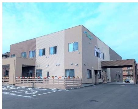
12月開設「成田ケアセンターそよ風」施設外観

「成田ケアセンターそよ風」は、日帰りで通えるデイサービスと短期滞在型のショートステイを併設した複合型介護施設です。住み慣れた地域での生活をより豊かにするため、幅広いサービスを通じてお客様の在宅生活をサポートします。