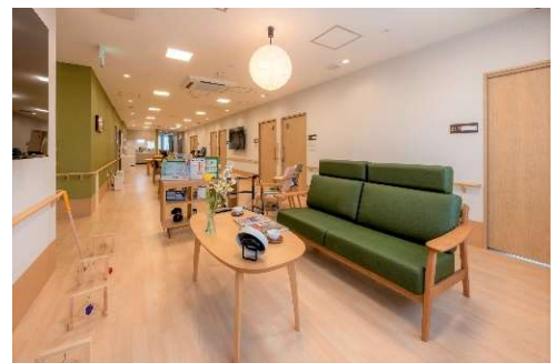
丸亀市の市木「ヤマモモ」をイメージした共同リビング

丸亀市の市木「ヤマモモ」と市花「サツキ」をイメージした家具を配置し、視覚や感性に訴える五感豊かな空間を演出しています。少人数ケアによるあたたかみのある関係づくりに加え、近隣施設「ツクイ丸亀」と合同で季節行事などを開催し、豊かな時間を提供します。