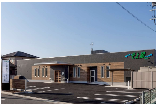
4月開設「まるがめショートステイそよ風」施設外観