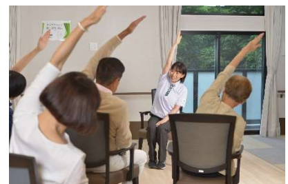
機能訓練イメージ

近隣エリアのショートステイ施設では対応が難しい機能訓練。当施設では日常生活動作の機能訓練に加え、理学療法士（PT）や作業療法士（OT）などのリハビリ専門職が、週1～2回来館し、お客さまの状態に応じた機能訓練を実施します。残存機能の維持や身体機能の変化の早期把握に努め、ご自宅での生活継続を見据えた支援を行っています。