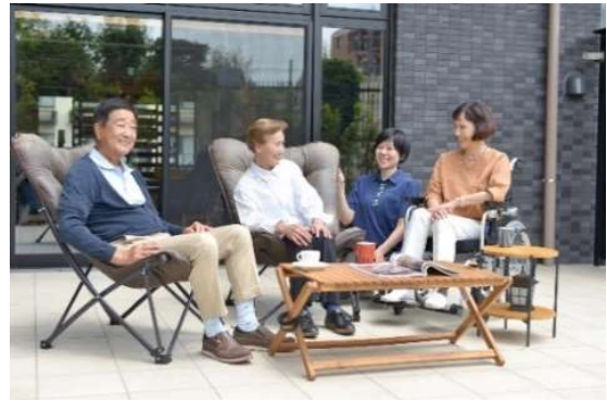
「そよ風」施設での滞在イメージ 近隣エリア

複数の介護サービスを一つの施設内で提供する「複合型施設」を多数展開しています。近隣エリアの事業所との連携を通じて、お客さまの身体状況に応じたスムーズなケア移行を、ワンストップで実現しています。