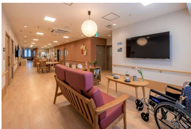
丸亀市の市花「サツキ」をイメージした共同リビング