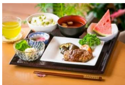
「そよ風」の食事イメージ

施設内の厨房で、管理栄養士監修のもと一食一食を丁寧に調理。栄養バランスに配慮した、温かくておいしい出来たての食事を提供します。