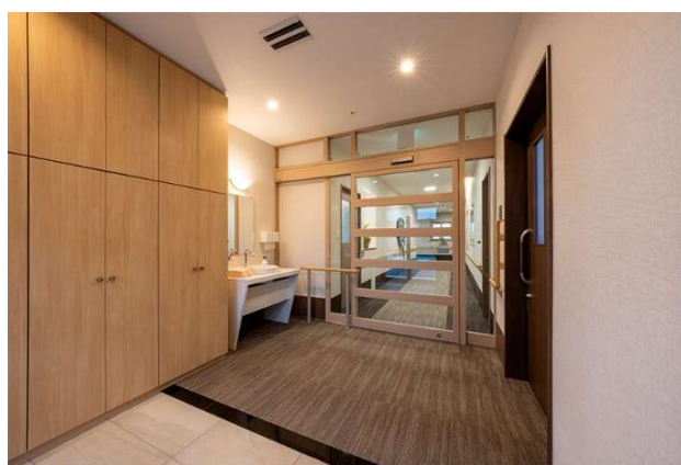
エントランス_平屋建てならではの移動しやすい動線を確保