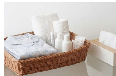
「手ぶらセット」イメージ

衣類やタオル、歯ブラシなどをそろえた「手ぶらセット」を無料で提供します。荷物の準備や洗濯の手間を軽減し、急な利用にも対応しやすい環境を整えています。