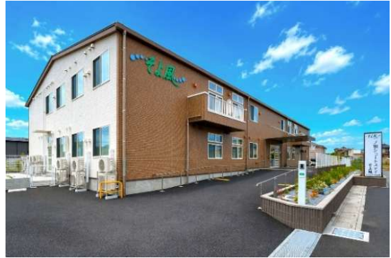
「一ノ割ショートステイそよ風」外観

ホームページ： https://www.sykz.co.jp/shisetsu-zaitaku/114903/