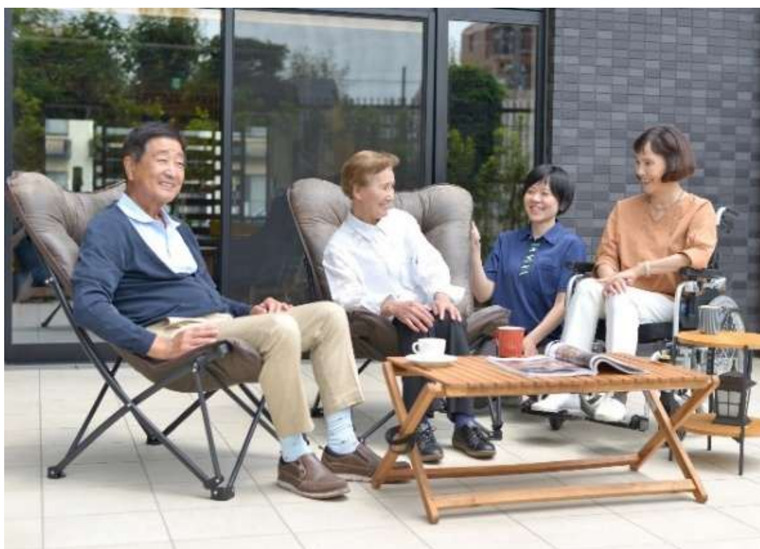
「そよ風」での滞在イメージ

本施設は、埼玉県内で 75 拠点目、ショートステイとしては 40 拠点目の施設となります。ショートステイ運営数ナンバーワン (※1) の実績で培った知見を活かし、「預かり」のイメージが強いショートステイを、「また利用したい」と思っていたいただける体験へと進化させることを目指します。