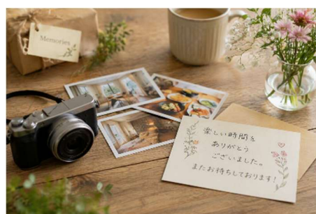
イベントを思い出に残す取り組みイメージ

季節行事や食事イベントなど、滞在を楽しんでいただくためのさまざまな企画を実施し、イベント後には写真などを通じて思い出として残る体験づくりに取り組みます。「ここに来てよかった」と感じていただける時間を積み重ね、また利用したいと思えるショートステイを目指します。