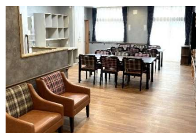
3つのテーマで構成された館内の一例「アメリカン」

館内はアメリカン、アジア、ヨーロッパの3つのテーマで構成。それぞれ家具や壁紙、装飾にもこだわり、フロアごとに異なる雰囲気を楽しめます。